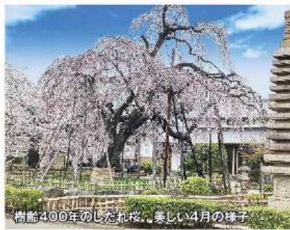
樹齢400年のしたれ桜。美しい4月の様子