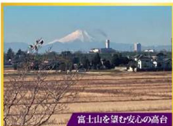
富士山を望む安心の高台