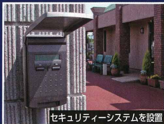
セキュリティーシステムを設置