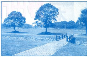
野田市スポーツ公園